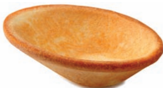
Bol 54,5 x 42 mm - 1 16,3 mm