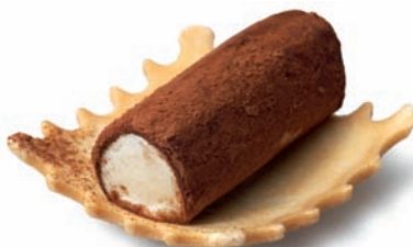
Sello ø 50 mm - 1 7 mm