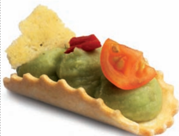
Taco 60 x 33 mm - 1 15,5 mm