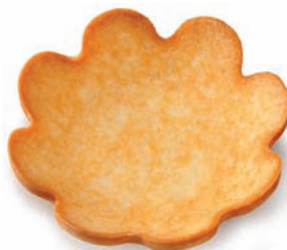
Margarita ø 51 mm - 1 10,5 mm