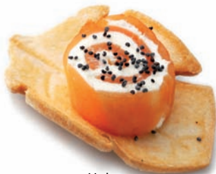
Hoja 67 x 41 mm - 1 13,5 mm