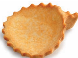
Pellizquito 51 x 49 mm - 1 16 mm