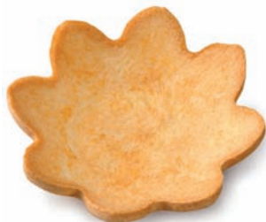
Girasol ø 53 mm - 1 10,5 mm