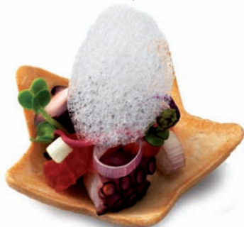
Nenúfar ø 57 mm - 1 15,5 mm